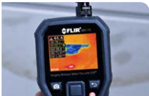
Detekcja problemów na wilgotnym suficie