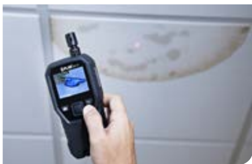
Technologia IGM wskazuje użytkownikowi, w którym miejscu ma wykonać pomiary